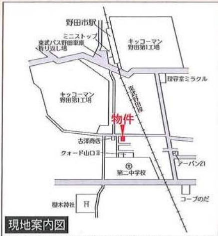
※図面と現況が異なる場合は現況を優先させていただきます

賃料: 56,000円 ~ 礼金: なし 敷金: 2ヵ月 管理費等: なし 契約期間: 2年 駐車場: 敷地内3,000円 保険: 20,000円/2年 ※ペット飼育の場合、その他条件有